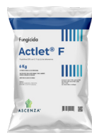
Sacco: 6-12 Kg Pallet: 600 kg