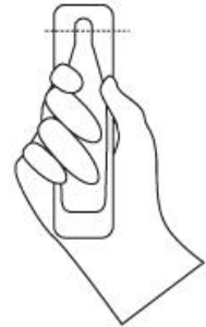
TAGLIARE SEGUENDO IL SEGNO TRATTEGGIATO