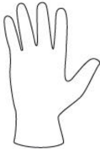
INDOSSARE UN GUANTO MONOUSO